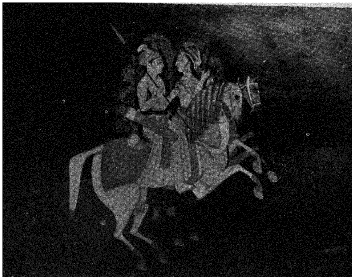
बाज़वहादुर तथा रूपमती